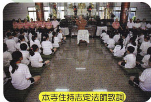
本寺住持志定法師致詞