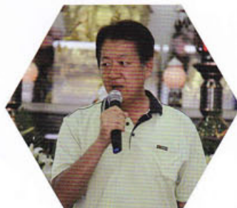
王市長參加開營典禮致詞