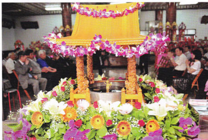
恭祝教主2556聖誕大典